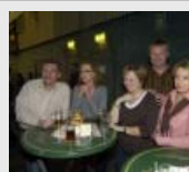
Grobschnitt in Senden...