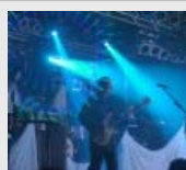
Grobschnitt in Senden...