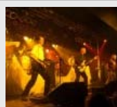
Grobschnitt in Senden...