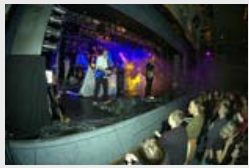
Grobschnitt begeisterte die 1000 Fans in der Sendener Steverhalle über drei Stunden mit alten und neuen, aber zumeist rockigen Stücken.